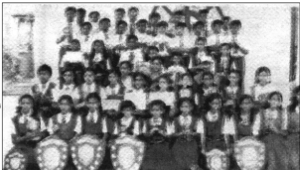
రాష్ట్రస్థాయిలో ఆడి బహుమతులు పొందిన ఆర్కూర్ మండలం మామిడిపల్లిలోని విజయ్ విద్యార్థులు

ఆర్కూర్, మార్చి 19: ఆర్కూర్ సబ్ డివిజన్లో గత ఇరవై ఐదు యేళ్లుగా విద్యా రంగంలో సేవలందిస్తున్న విజయ్ హైస్కూల్ యాజమాన్యం ఇటీవల క్రీడా రంగంపై దృష్టి నిలపడంతో జాతీయస్థాయిలో ఎందరో క్రీడాకారులు తమ నైపుణ్యాన్ని చాటి రాష్ట్రానికి పేరు తెస్తున్నారు. ప్రైవేట్ పాఠశాల అనగానే చదువుకోవడమే గుర్తుకు వచ్చే ఈరోజుల్లో పాఠశాలలో ఇద్దరు వ్యాయామ ఉపాధ్యాయులను నియమించి చదువుతోపాటు మానసిక వికాసాన్ని విద్యార్థులకు కలిగిస్తున్నారు. ఈ సంవత్సరంలోనే ఏడుగురు విద్యార్థులు జాతీయ స్థాయిలో యాభై మంది విద్యార్థులు రాష్ట్ర స్థాయిలో ఆటలు ఆడి