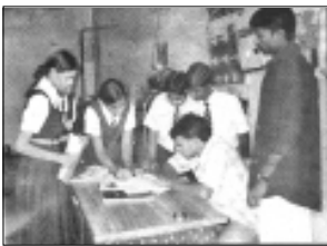
ఆర్కూర్లో వృధా నీటి వాడకాన్ని వివరిస్తున్న విద్యార్థులు

ఆర్కూర్ రూరల్, నవంబర్ 19 (న్యూస్ టుడే): నీటి పాడుపుపై ఆర్కూర్ మండలం మామిడిపల్లిలోని విజయ్ హైస్కూల్ విద్యార్థులు శనివారం స్థానిక పరిశ్రమల్లో ప్రచారం చేశారు. మురికినీటిని శుభ్రపరిచే