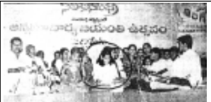
అన్నమయ్య కీర్తనలు గానం చేస్తున్న చిన్నారులు (భావన, 6వ తరగతి విజయ్ హైస్కూల్, ఆర్యూర్)