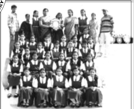
Winners in March past at Mandal Tournaments - 2005-06