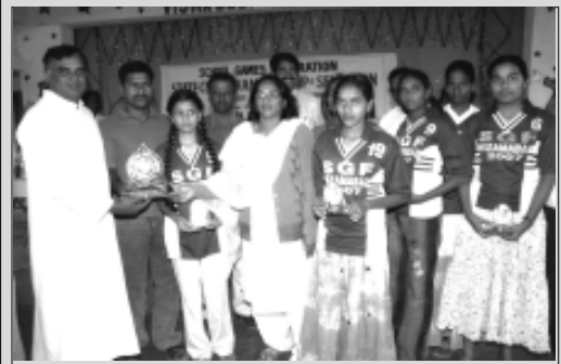
Dist. team in Chess bagged 3rd place in state