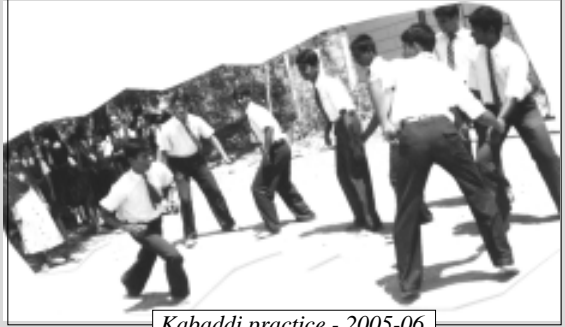
Kabaddi practice - 2005-06