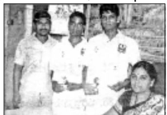
క్రీడాకారులను అభినందిస్తున్న ప్రిన్సిపాల్