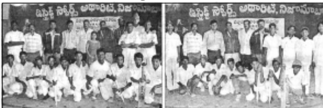
అంతర్ పాఠశాలల క్రికెట్ టోర్నమెంట్ లో విజయం సాధించిన అండర్-16 అర్చన్ జట్టు, అండర్ 14 రూరల్ జట్టు