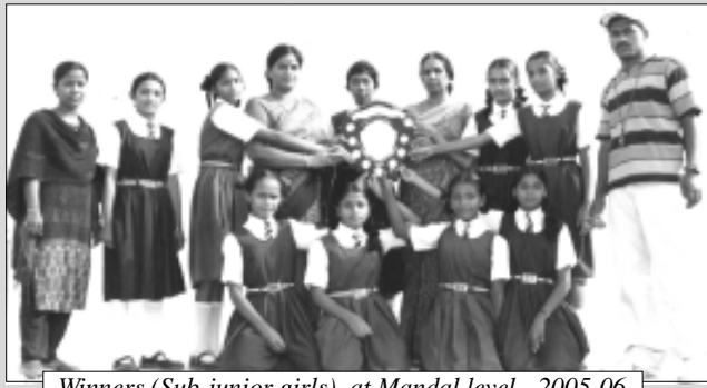
Winners (Sub-junior girls) at Mandal level - 2005-06