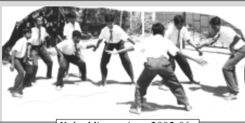
Kabaddi practice - 2005-06