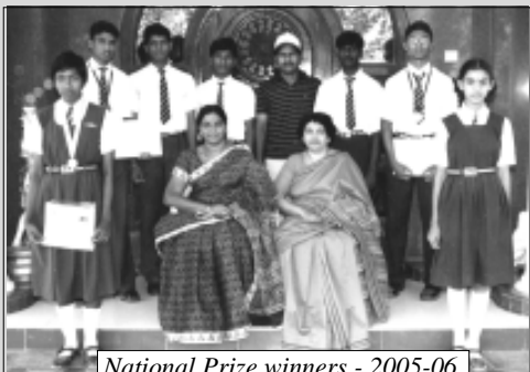
National Prize winners - 2005-06