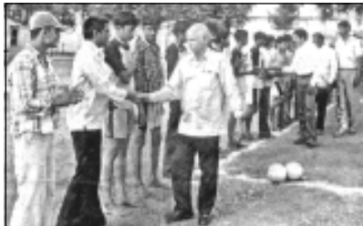
కమ్మరపల్లిలో క్రీడాకారులతో కరాచలనం చేస్తున్న ఎంపిడివ్, ఎమ్మార్వో

ఆర్కూర్టౌన్, మే2 (ఆన్లైన్): విద్యార్థుల కోసం ఆర్కూర్లో విజయ్ హైస్కూల్ ఆవరణలో మంగళవారం వేసవి వాలీబాల్ క్రీడా శిక్షణ శిబిరం ప్రారంభమైంది. ఈ శిబిరం నెలాఖరు వరకు కొనసాగుతుంది.