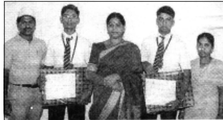
జాతీయస్థాయి క్రికెట్ లో ప్రతిభ కనబర్చిన ఆర్కూర్ మండలం మామిడిపల్లిలోని విజయ్ హైస్కూల్ కు చెందిన విద్యార్థులు