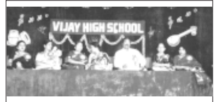
Guests on the dais.