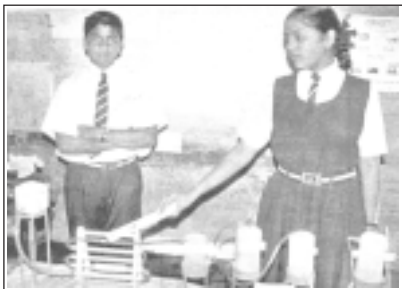
'లిక్విడ్ గూడ్స్' తయారీ విధానాన్ని వివరిస్తున్న నిజామాబాద్ విజయ్ హైస్కూల్ విద్యార్థులు