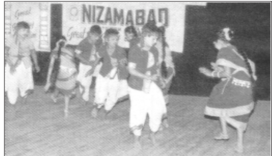
సాంస్కృతిక ప్రదర్శనలిస్తున్న విజయ్ పబ్లిక్ స్కూల్ విద్యార్థులు