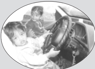
కారులో పికాపుకెళ్ళే పాలబుగ్గల పసిడివాడ!