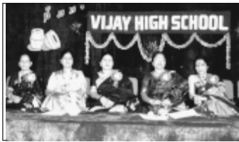
Guest of Honour: Smt. Rama Prabha, (Famous Cine Artist)