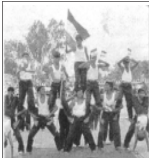
స్వాతంత్ర్య దినోత్సవం (2004) సందర్భంగా పోలీస్ పెరేడ్ గ్రౌండ్ లో విజయ పబ్లిక్ స్కూల్ యు.ఎస్.సి విద్యార్థులు ప్రదర్శించిన 'పిరమిడ్స్'