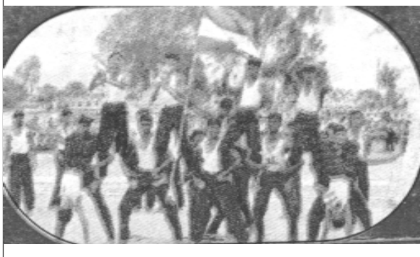
పోలీస్ పెరేడ్ గ్రౌండ్ లో జరిగిన స్వాతంత్ర్య దినోత్సవం (2004) సందర్భంగా విజయ పబ్లిక్ స్కూల్ యు.ఎస్.సి విద్యార్థులు ప్రదర్శించిన 'పిరమిడ్స్'